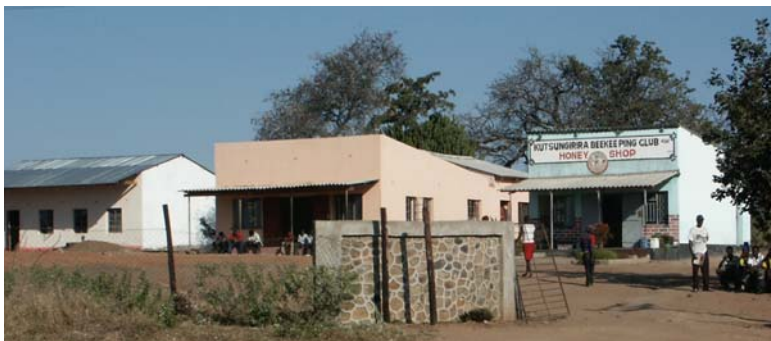
De drie hoofdgebouwen van KBS

Voor de overige kosten voor training en de uitrusting zal BeeSupport fondsen blijven werven