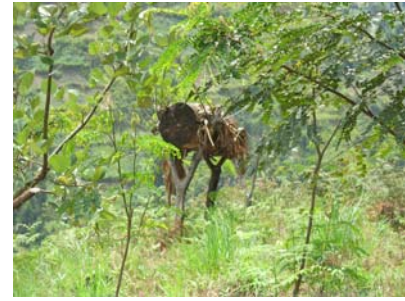
Uitgeholde boomstam als bijenkast