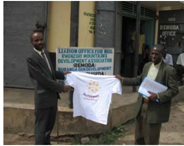
REMODA en BeeSupport