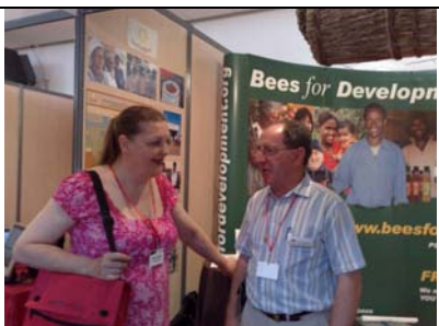
Samenwerking en uitwisseling

Niemand kon er meer omheen dat de bij een belangrijk beestje is.