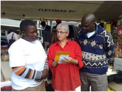
Discussie over markt zaken