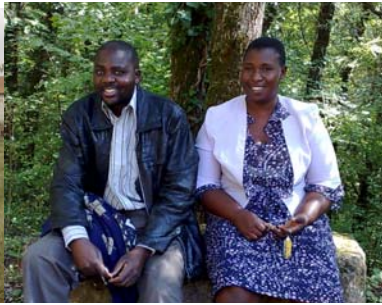
en even uitrusten