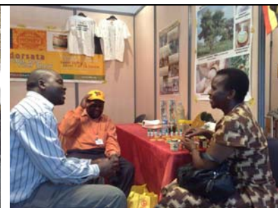
Ervaringen delen en verder denken