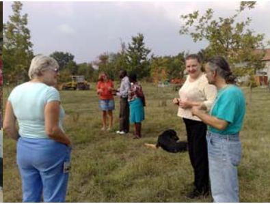
In gesprek met imkers in Frankrijk