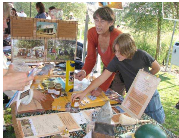
BeeSupport kraam op de markt