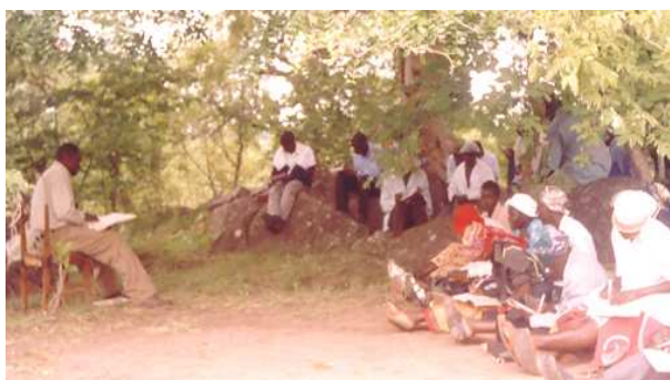
Theorieles in de open lucht

In Zimbabwe, voor het Imker Trainingcentrum, is men bezig met de voorbereidingen van de bouw. Het vormen en bakken van de 40 000 stenen en graven van geulen voor de waterleiding zijn klaar. Deze werkzaamheden werden door de leden van de Kutsungirira Beekeeping Club zelf gedaan